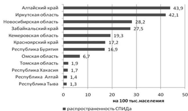
Рис. 3. Распространенность синдрома приобретенного иммунодефицита у больных ВИЧ-инфекцией на территории СФО (2015 г., на 100 тыс. населения)

Летальность от ВИЧ-инфекции является одним из показателей эффективности мероприятий по раннему выявлению и своевременной диагностике, лечению, уходу, диспансерному наблюдению больных. Годовая летальность отражает долю больных ВИЧ-инфекцией, умерших в срок до одного года с момента выявления и постановки диагноза.