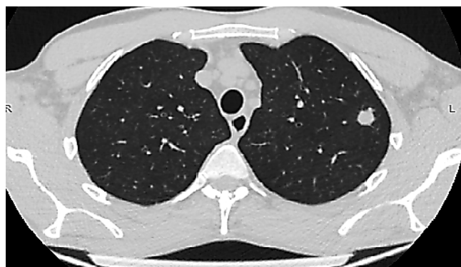
Рис. 3. Округлое образование в верхней доле левого легкого у больного с ВИЧ-инфекцией

структуры, с тяжами к утолщенной плевре и в окружающую паренхиму, (см. рис. 2). Иммуный статус: CD4+ лимфоциты — 175 клеток (7%), вирусная нагрузка менее 40 копий/мл. Фибробронхоскопия патологических изменений не выявила.