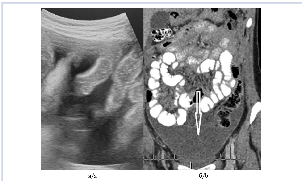
Рис. 1. Туберкулезный перитонит.

а — петли тонкой кишки с утолщенными стенками и свободная жидкость в брюшной полости (эхограмма); б — накопление свободной жидкости в малом тазу и между петель кишечника (указано стрелкой) (мультиспиральная компьютерная томография).