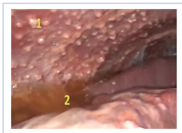
Рис. 2. Туберкулезный перитонит (лапароскопия).

Во время оперативного вмешательства у 13 (35,1%) больных в брюшной полости обнаружен выпот (серозный, серозно-фибринозный, с геморрагическим компонентом) объемом 2000—2500 мл. При этом не было бугорковых образований на париетальной и висцеральной брюшине. Листки брюшины на отдельных участках отечны с выраженным венозным полнокровием. В некоторых местах, особенно в области малого таза, брюшина утолщена, тусклая, имела слоистую структуру с линейными жидкостными зонами. Спаечный процесс представлен локальными плоскостными и шнуровидными сращениями. Петли тонкой кишки в состоянии пареза, расширены более 3,5—4 см, на серозной оболочке отдельных участков тонкой кишки имелись «свежие» плоскостные и нитевидные наложения фибрина. В 5 случаях при деформации петель тонкой кишки спаечным процессом выполнен адгезиолизис. Характер перитонеального выпота при цитологическом исследовании трактовали как лимфоцитарный в 26 (70,3±14,7%) случаях, а в 11 — преобладали клетки нейтрофильного ряда. Высокий градиент (более 11 г/л) концентрации альбумина между сывороткой крови и экссудатом