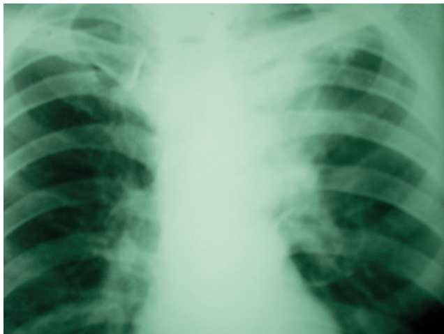
Рис. 1. Актиномикоз легких. Медиастинально-легочная форма Примечание: обзорная рентгенограмма грудной клетки. В верхней доле левого легкого участки инфильтрации интенсивного характера с нечеткими контурами, расположенные преимущественно парамедиастинально, сливаются с тенью средостения и корнем легкого.

У 11 (47,8 %) больных заболевание началось после травмы грудной клетки в результате автомобильной катастрофы, длительного давления в области спины твердым предметом, находящимся в рюкзаке, укола гвоздем, удара во время драки и т. д. У 5 (21,7 %) женщин актиномикоз появился на месте операционного вмешательства после радикальной мастэктомии по поводу рака молочной железы. Из 4 больных с медиастинально-легочной формой у 2 (8,7 %) пациентов актиномикоз развился на фоне инфильтративного туберкулеза, у 2 (8,7 %) человек — на фоне абсцесса легкого.